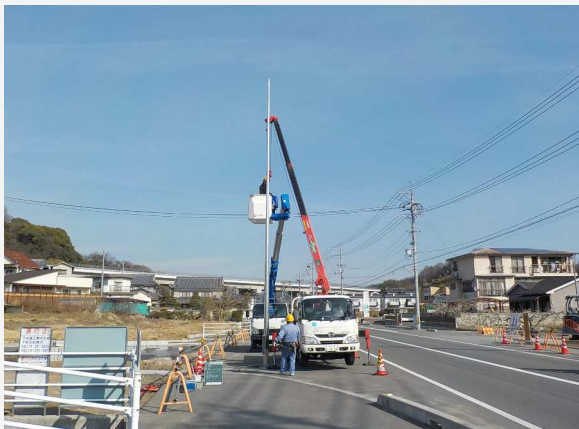
施工中～ クレーンと高所作業 車でポールを設置し ます