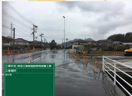
施工後 ピシッとまっすぐに 設置できて満足です