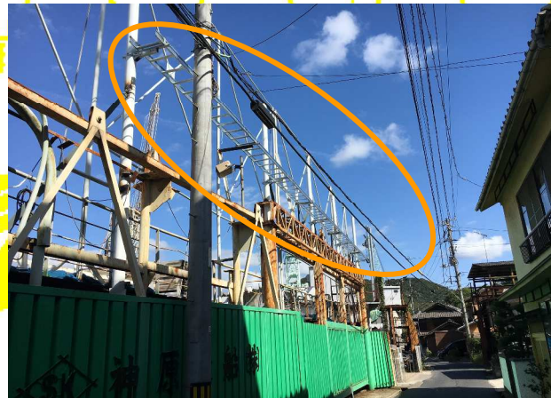
移設の準備のため、ケーブルラックという 電線の通り道を設置しました