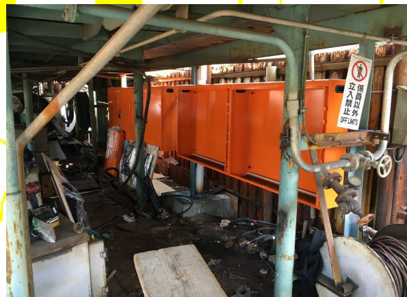
分電盤を取替ました。スッキリ綺麗になりました