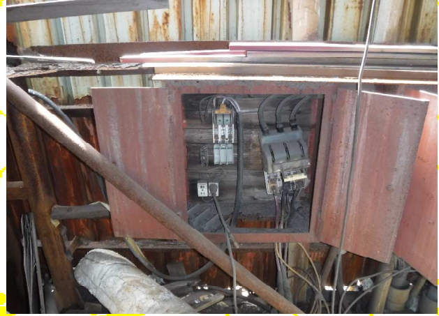
老朽化により分電盤が錆びています